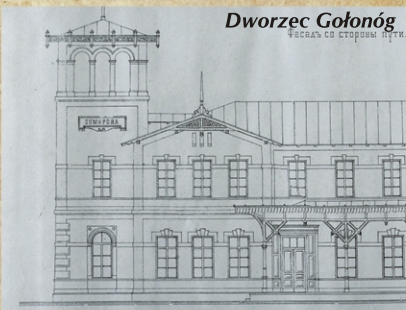
Dworzec Gołonóg ФЕЦАЯ СО СТОРОНЫ ПУТЯ