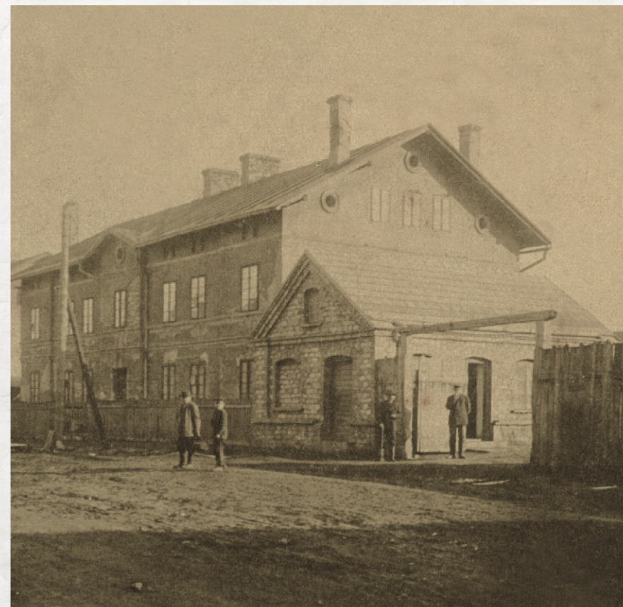
Wejście do huty cynku Konstanty 1906 r. widoczne od strony obecnej ul. Królowej Jadwigi

Huta cynku Konstanty została założona w 1816 roku i działała do II wojny światowej. Wytapiano tu cynk z rudy pochodzącej m.in. z kopalń w Strzemieszycach Małych. Wytopiony cynk przewożono do walcowni w Sławkowie, gdzie poddawano go dalszej obróbce. Huta była