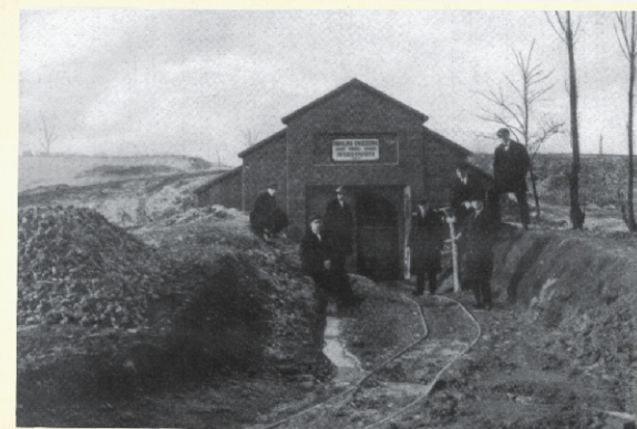
Kopalnia Ćwiczebna 1929 r.

Kopalnia Ćwiczebna zlokalizowana jest w południowo-wschodniej części obszaru górniczego dawnej kopalni węgla „Paryż”, w sąsiedztwie ulic Górniczej i Legionów Polskich w Dąbrowie Górniczej. Udostępniono tu dwa pokłady węgla kamiennego. W wyrobiskach zaprezentowane są także maszyny i urządzenia służące do urabiania i transportu węgla, takie jak kombajn węglowy, przenośniki i wozy kopalniane. Budowa kopalni została rozpoczęta w kwietniu 1927 roku. W latach 1958–1961 wydrążono wyrobiska pochyłe (upadowa I zwana też „kamienną” i upadowa II „południowa”), a także wyrobisko poziome, łączące upadowe. Łączna długość nowo powstałych wyrobisk wynosiła około 100 m, przy różnicy poziomów 14,5 m. W latach późniejszych (do 1966 roku) przeprowadzono prace górnicze polegające na zwiększeniu liczby wyrobisk. Wykonano między innymi chodnik ścianowy, podścianowy, szkoleniowy i wodny. Łączna długość nowo powstałych wyrobisk wyniosła około 180 m. Zajęcia praktyczne uczniów szkół górniczych były realizowane w Kopalni Ćwiczebnej do 1994 roku, a obecnie jest to obiekt turystyczny wpisany na Szlak Zabytków Techniki Województwa Śląskiego.