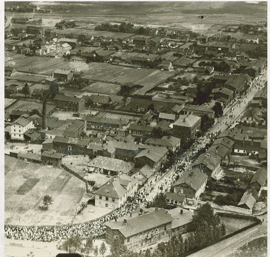
Unikalne zdjęcie kolonii Reden z 1919 roku. Widać na nim zakręt dzisiejszej ulicy Królowej Jadwigi w rejonie Merkurego

Najstarszym osiedlem górniczym w naszym mieście jest tzw. Reden. Siatkę ulic wytyczono w latach 20. XIX wieku. Resztę osiedla zajmowały niewielkie działki zabudowywane jednorodinnymi domami. Górnicy budowali swoje domy, otrzymując preferencyjne