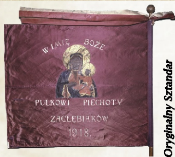
Oryginalny Sztandar 11 Pułku Piechoty