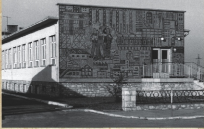
Mozaika na ścianie SP nr 17