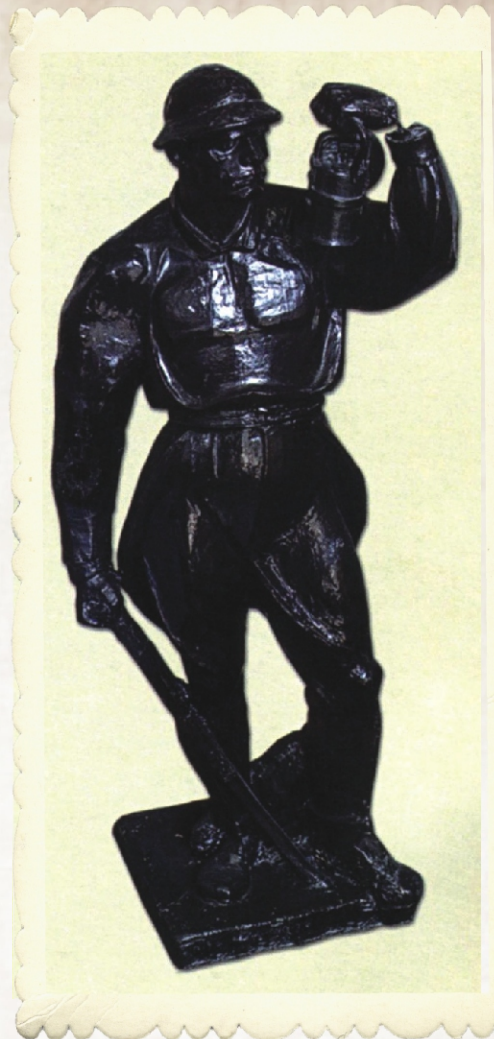
„Górnik” autorstwa Jana Raszki, prezentowany w holu III Pawilonu ZSZ „SztYGarka”

Wszystkich chętnych i spragnionych poznania francuskiego odcienia naszych dąbrowskich dzieł sztuki zapraszamy do sięgnięcia po publikację „Bartholdi i Gravier. Francuskie konteksty dzieł sztuki związanych z przemysłem XIX i XX wieku w województwie śląskim”. Bezpłatne egzemplarze wyszukanego typograficznie wydawnictwa można otrzymać w Muzeum Miejskim „SztYGarka”.