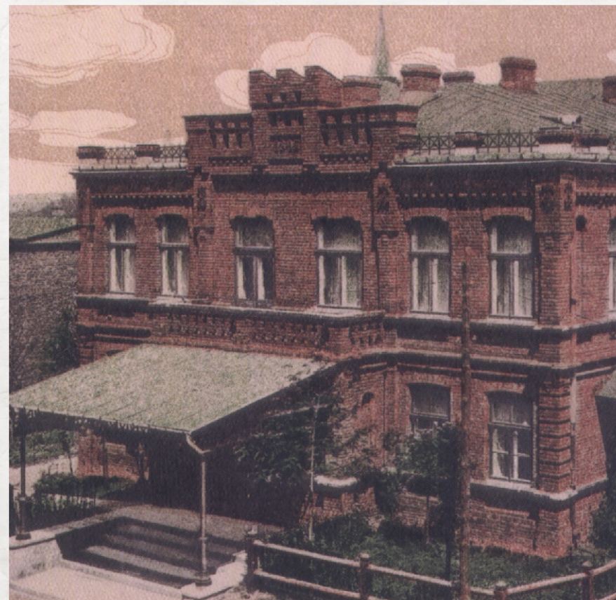
Resursa dąbrowska z 1895 r.

Przy ulicy 3 Maja znajduje się budynek Resursy. Był to tzw. klub towarzyski, wybudowany dla miejscowych obywateli. Resursa dąbrowska powstała w 1895 roku. Ceglany budynek ozdobiony był szeregiem detali architektonicznych. Znalazła się w nim sala widowiskowa, na której deskach