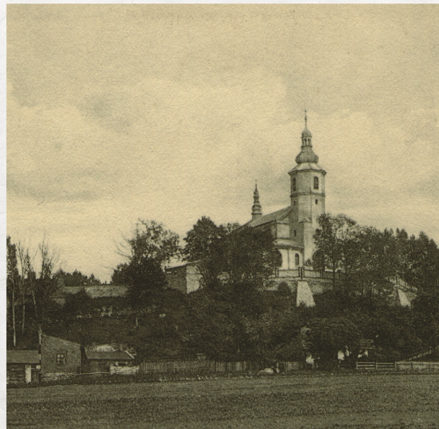
Gołonóg. Kościół św. Antoniego w 1930 roku oraz na obrazie olejnym z 1850 r.

Kościół św. Antoniego w Gołonogu został ufundowany 8 lipca 1675 roku przez biskupa krakowskiego Andrzeja Trzebieckiego i konsekrowany przez niego w 1678 roku. Biskup Trzebiecki był ówczesnie najważniejszą postacią w Rzeczypospolitej. Po śmierci