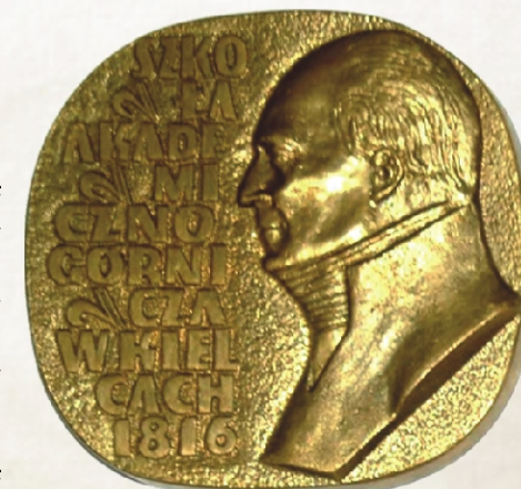
Okolicznościowa plakietka z podobizną Stanisława Staszica – twórcy szkoły górniczej w Kielcach