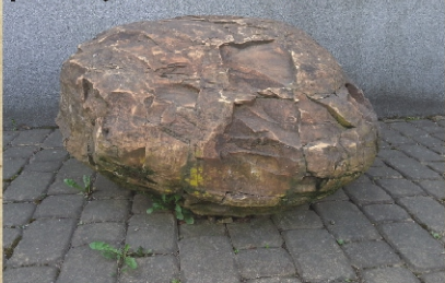
Sferosyderyt znajdujący się przed wejściem do Muzeum