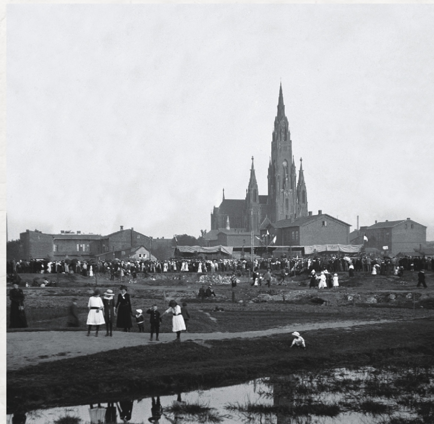
Centrum Dąbrowy Górniczej tuż przed wybuchem I wojny światowej