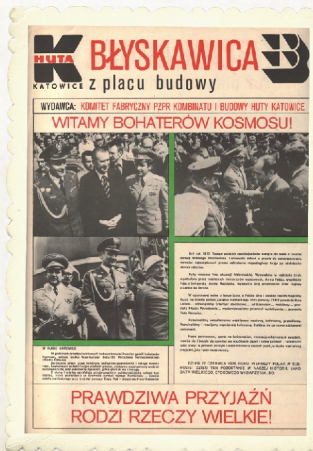
Gazeta zakładu Huta Katowice – „Błyskawica”