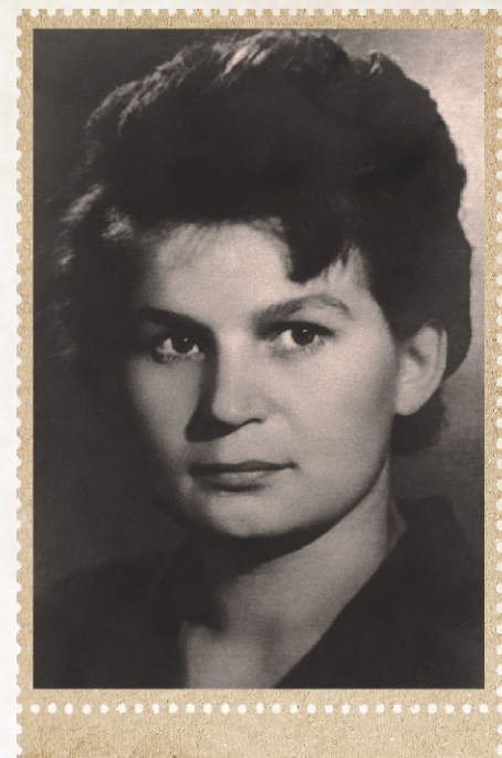
Walentyna Tierieszkowa, fotografia z 1963 r.

Dopiero w kilka lat po odwiedzinach rosyjskich kosmonautów Zagłębie doczekało się wizyty pierwszego Polaka w kosmosie. 26 lipca 1978 roku załoga statku Sojuz 30: Mirosław Hermaszewski i Piotr Klimuk, odwiedziła Dąbrowę Górniczą. Powitano ich jak prawdziwych bohaterów, z pełnymi honorami. Pod Pałacem Kultury Zagłębia odbyła się uroczystość, podczas której kosmonauci spotkali się ze społeczeństwem i władzami miasta. Goście odwiedzili również Hutę Katowice, zwiedzali rejon wielkich pieców i świeżo oddaną do użytku walcownię. Z wizyty zachowało się w zbiorach muzealnych wiele zdjęć oraz okolicznościowy egzemplarz gazety zakładowej „Błyskawica”. Obecnie mało kto już pamięta o czasach „pionierów kosmosu” i o tym, jak wielkie emocje wzbudzał wyścig o palmę pierwszeństwa w kosmonautyce.