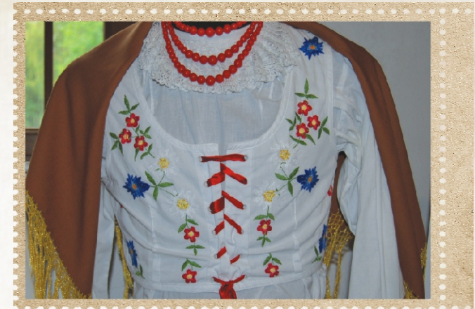
Rekonstrukcja stanika zagłębiowskiego

Kilka lat temu podjęliśmy w Muzeum próbę odtworzenia stroju zagłębiowskiego. Efekty tej próby, jak i oryginalne stroje używane przez Koło Gospodyń Wiejskich, możemy oglądać na wystawie etnograficznej. Od razu widać, że ubiory te różnią się od siebie. Skąd więc taka rozbieżność w wyglądzie strojów zagłębiowskich? Czy możemy w ogóle wyróżnić jeden typ stroju dla naszego regionu? Bliskie sąsiedztwo