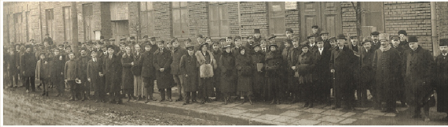
Wydawanie żywności dla mieszkańców w 1917 roku

Arkadiusz Rybak arybak@muzeum-dabrowa.pl