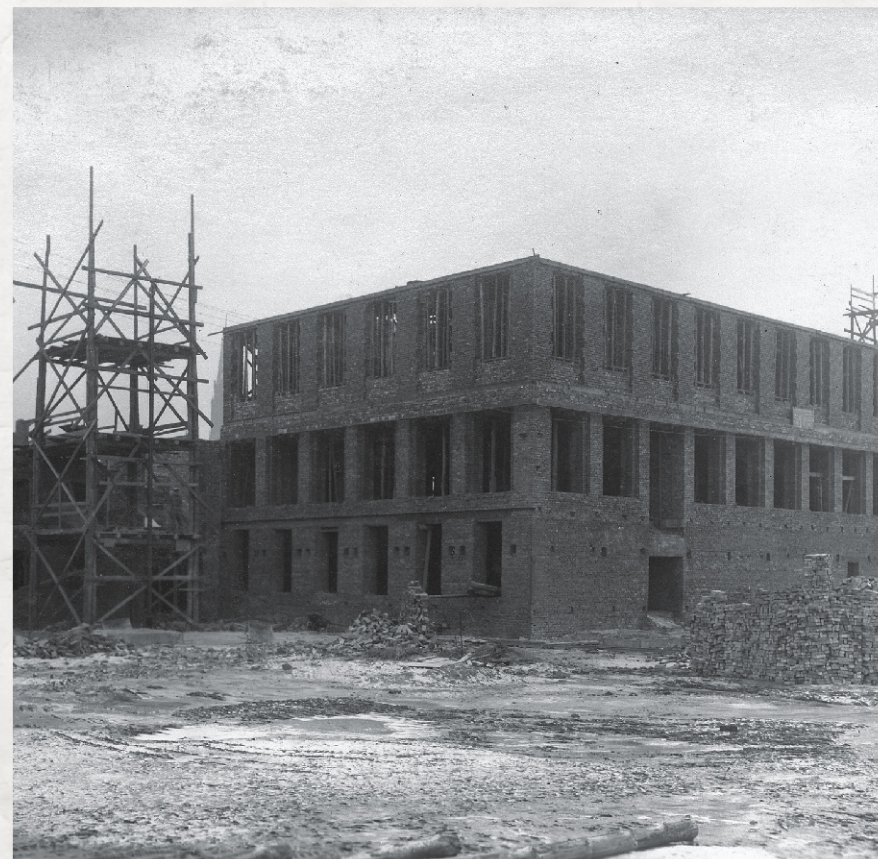
Pałac Kultury Zagłębia w czasie budowy

11 stycznia 1958 roku, po 7 latach budowy, otwarto Pałac Kultury Zagłębia. Ogromna budowla stanęła na granicy dawnego osiedla Reden i osiedla Huty Bankowej. Teren pod budowę, chociaż podmokły, oczyszczono z dzikiej zabudowy i w ten sposób rozpoczęto tworzenie centrum