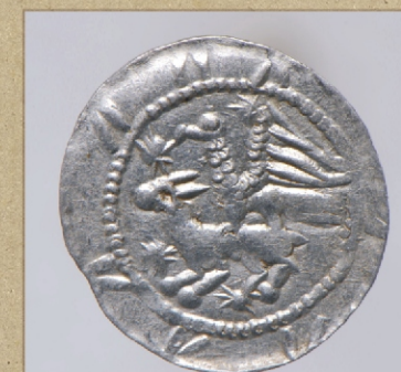
Denar Władysława Wygnańca