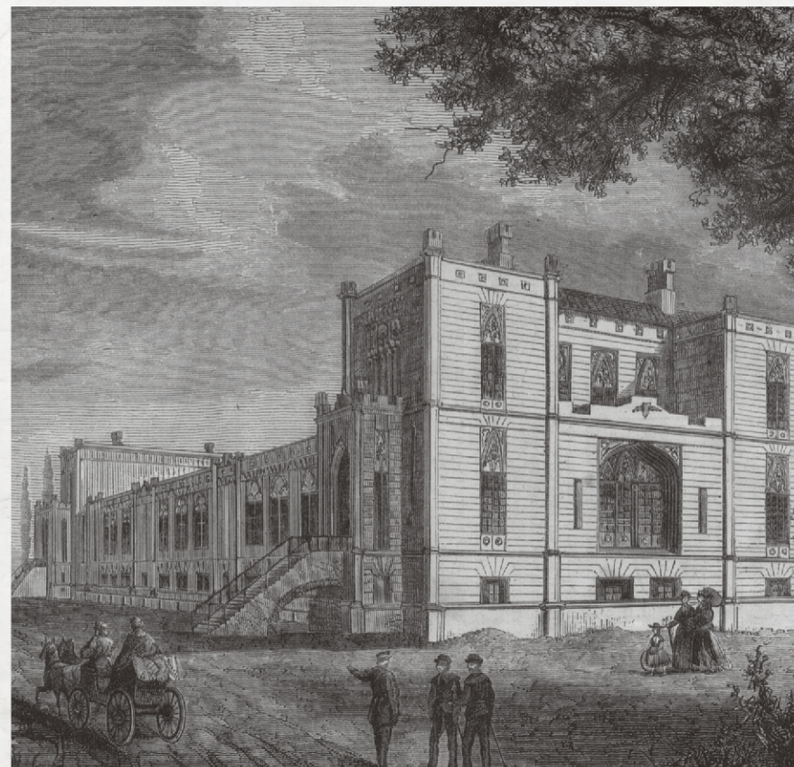
Budynek Muzeum w 1870 roku

W centrum miasta przy ulicy Legionów Polskich znajduje się siedziba Muzeum Miejskiego „Szttygarka”. Okazały gmach jest obecnie najstarszym budynkiem użyteczności publicznej w Dąbrowie Górniczej. Został zaprojektowany i wybudowany w latach 1839-1842 przez